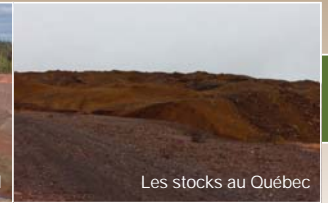
Les stocks au Québec