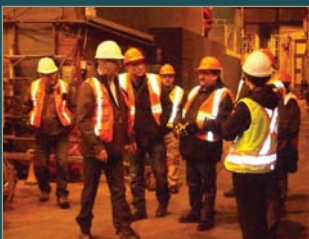
January 2013 IBA Meeting Site Tour: (Top and bottom) Site tour of LIM's rail maintenance centre