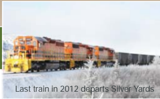
Last train in 2012 departs Silver Yards