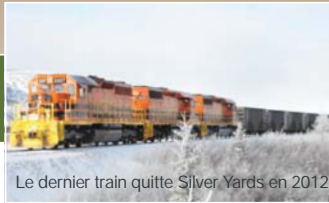
Le dernier train quitte Silver Yards en 2012

pour le trimestre se terminant le 31 décembre 2012