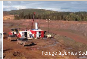
Forage à James Sud